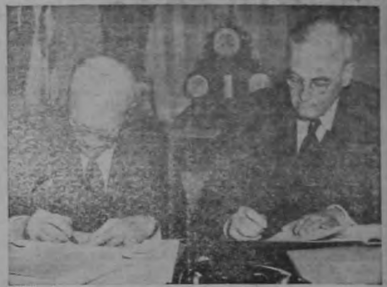
FIRMADO EL HISTORICO PACTO DE PARIS. —En la Casa Blanca, en Washington, el Presidente Eisenhower y el Secretario de Estado John Foster Dulles, ponen sus firmas al histórico Pacto de París que ha puesto fin a diez años de ocupación de la Alemania Occidental.

MOSCU, 6 (INS) — Se informa que una Misión Agrícola Rusa está haciendo preparativos para visitar próximamente los Estados Unidos, con "status oficial" Radio Moscú, fuente de la información, hizo notar que tal "status" circunvendría el procedimiento al uso por los Estados Unidos en relación con el otorgamiento de visas a nacionales extranjeros.