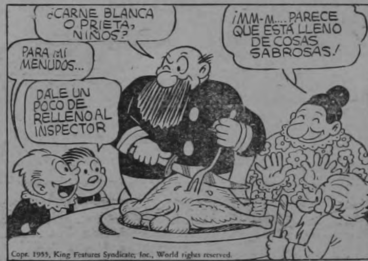
Copy. 1955, King Features Syndicate, Inc., World rights reserved.