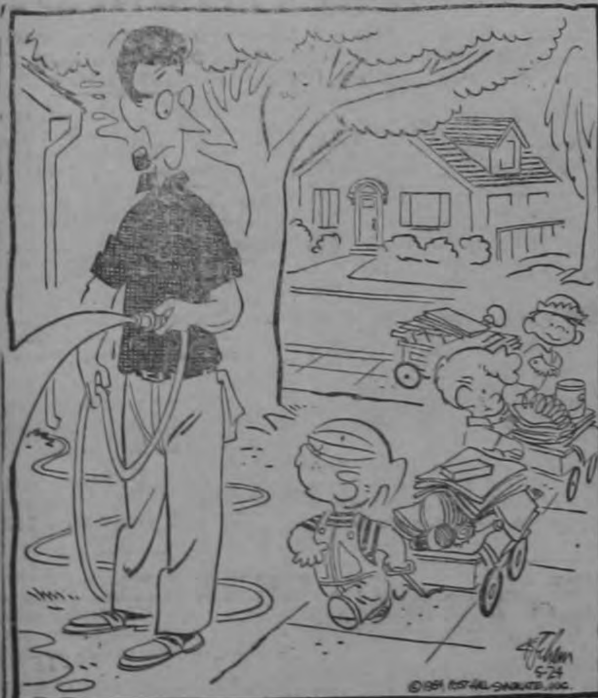
¿Está abierta la puerta del garage?