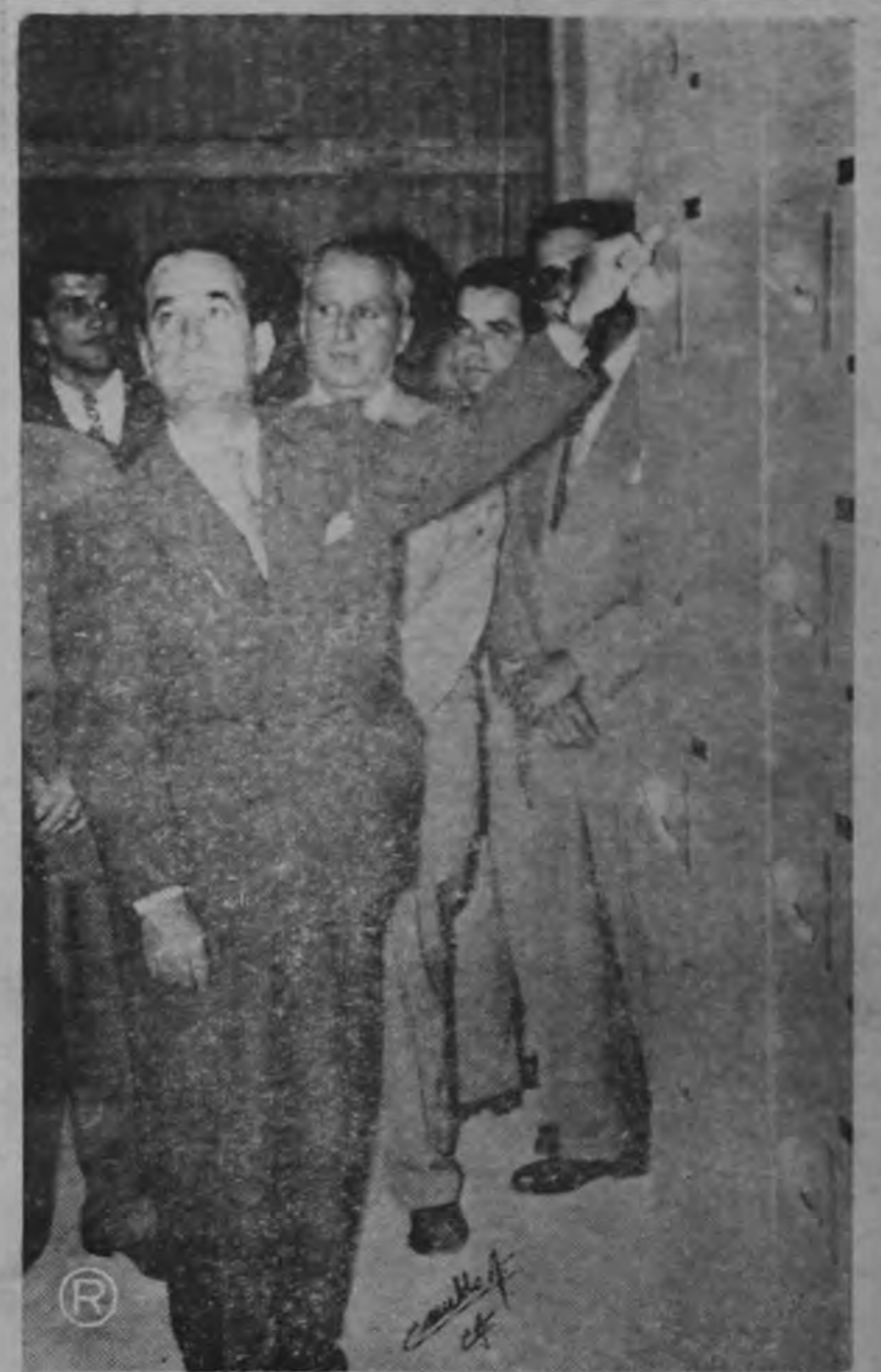
INAUGURACION OFICIAL.—El señor Presidente Figueres cuando apretaba el botón por medio del cual se pusieron a funcionar las plantas de Químicas Agrícolas Centroamericanas, que quedaron ayer oficialmente inauguradas.

Tenemos confianza en la prosperidad de esta empresa y que los beneficios que habrá de proporcionar al país serán cuantiosos porque en prenda de ello está la preocupación de sus promotores, lograda satisfactoriamente, de ponerla bajo la dirección experta de técnicos ampliamente capacitados.