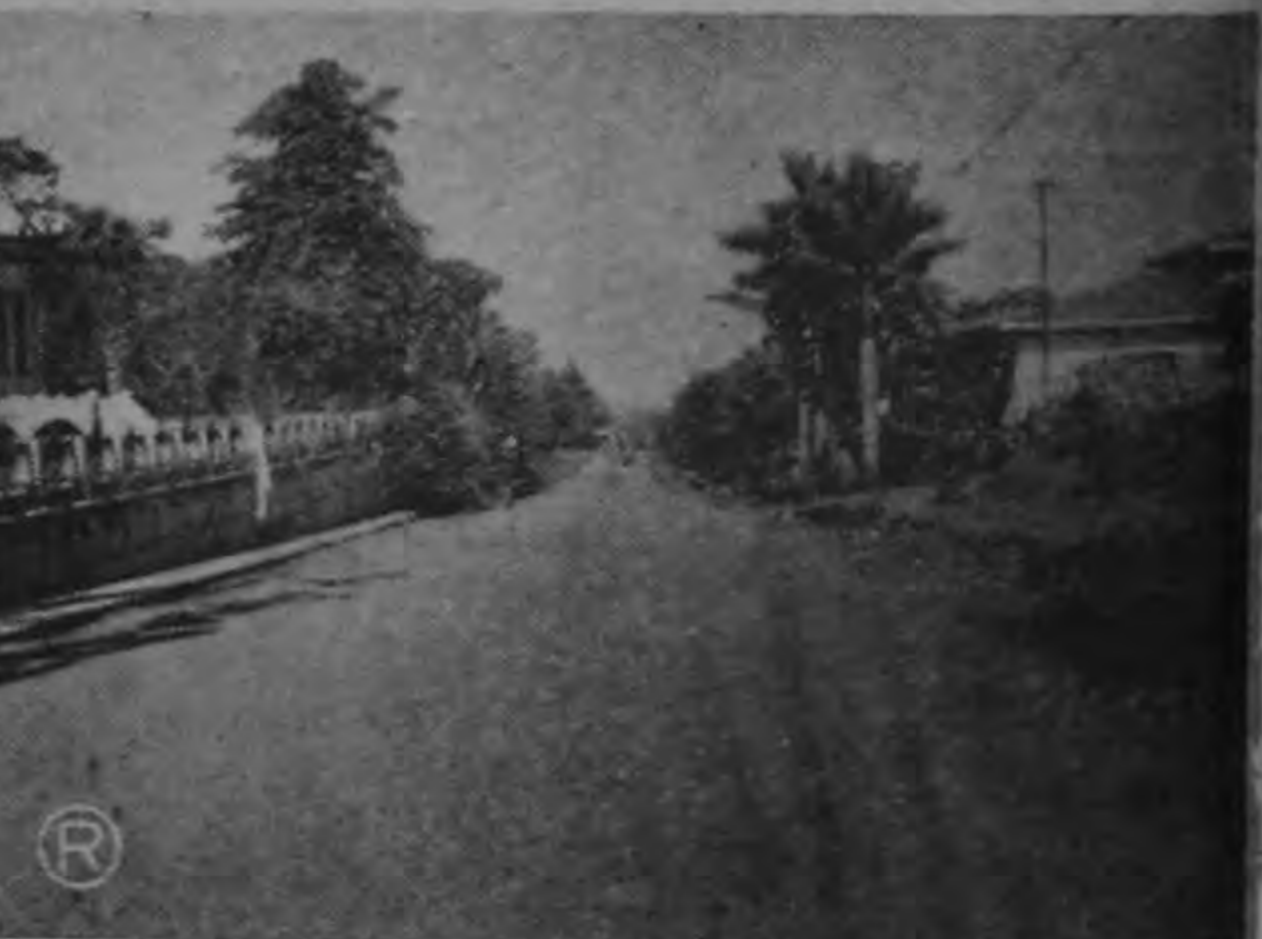
EL MOP. MEJORA LAS CARRETERAS DEL PAIS. A LA SALIDA DE SAN FRANCISCO DE HEREDIA.—Este trecho de la carretera central estaba en malas condiciones: pavimentación de concreto muy fracturada y base inestable por exceso de agua en la subrasante. Esta obra tuvo las siguientes mejoras: se construyeron drenajes, se estableció el concreto fracturado y se colocó sobre éste una capa de impermeabilización. Además fue construido un pavimento asfáltico, de dos pulgadas de espesor y se amplió en dos metros por cada lado.