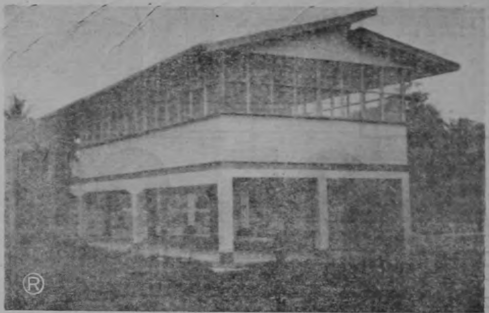
OTRA ESCUELA TIPO CONSTRUIDA POR EL MOP. —Escuela de Estrada, prototipo de construcción adaptada al trópico. La Escuela de Estrada, en la región Atlántica, constituye como la de Veintiocho Millah, otro ejemplo de edificio funcional, especialmente diseñado para su medio ambiente. Como observará el lector, está levantada sobre el nivel del terreno, de manera que pueda tener una amplia protección contra la humedad del mismo, disponiendo también, de un espacio extra en el que el alumnado puede hacer sus recreos, durante la temporada de lluvias. Los corredores del piso alto, y todos los salones de clases, dirección, están protegidos por teja metálica contra los insectos, precaución indispensable en aquellas zonas. La Escuela de Estrada constituye pues, otro prototipo del edificio funcional adaptado al medio que el MOP, ha estado diseñando de acuerdo con la zona en que va cada construcción.